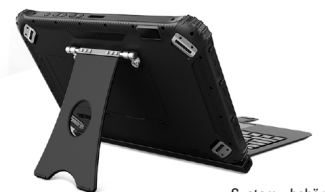
Systemzubehör: Outdoor Tastatur / 2-in1 Lösung.

So ist das BULLMAN DirtPad R12 auch ohne WLAN- und Stromnetzverbindung beliebig und fast überall voll einsetzbar.